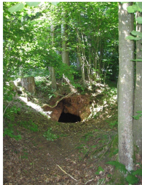
Rundhöcker Lehen mit Schurfbau

Sie sind nicht zu verwechseln mit den sogenannten Drumlins , da die Rundhöcker aus dem im Untergrund anstehenden Gestein bestehen, während die Drumlins aus Lockersedimenten und Geschiebe zusammengesetzt sind.