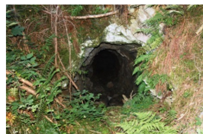
Mundloch eines der Stollen bei Edt

Stollen und Pingen Edt: Die Kupfererzlagerrstätten bei Mühlbach und Bischofshofen liegen am nördlichen Rand der Grauwackenzone (altpaläozoische Gesteine), nahe der Grenze zu den nördlichen Kalkalpen. Die Stollen in Edt wurden z.T. bereits in prähistorischer Zeit in das widerstandsfähige Eisenkarbonat getrieben. Auch die vielen im Wald verteilten Pingen zeugen von früherer bergbaulicher Aktivität. Bei der Wiederentdeckung der Kupfererzlagerrstätten im 19. Jahrhundert wurden die Bergbauegebiete nach bergmännischen Gesichtspunkten in ein Nord- und ein Südrevier unterteilt, wobei die Stollen am Buchberg zum Südrevier des Lagerstättendistrikts gezählt wurden. Die Lagerstätte wurde durch zwei Hauptstollen - den oberen Buchbergstollen (878 m) und den unteren Buchbergstollen (715 m) erschlossen, außerdem findet man mehrere Schurfstollen und Schurfschächte. Aufgrund der isolierten Lage des Vorkommens sind die Stollen am Buchberg jedoch nie über das Erkundungsstadium hinausgekommen.